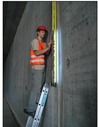
Setzungsmessung von Tunnelportal