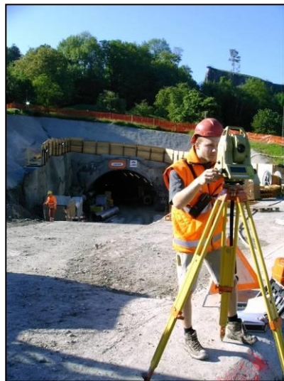
Absteckung bei Tunnelportal