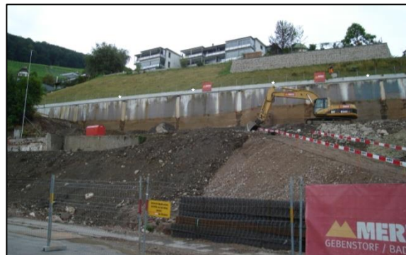
Baugrube Badresidenz Hirschen