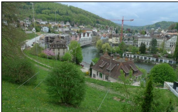
Bäderquartier: Gelände mit grösserem Gefälle

Seit der Fertigstellung des Tagbautunnels Ennetbaden im Jahr 2006 werden diverse Neubauten im attraktiven Bäderquartier realisiert. Darunter die Badresidenz Hirschen und die Überbauung Goldwand. Da die Bauzonen im Gelände mit grösserem Gefälle liegen, müssen Baugruben mit hohen Wänden ausgehoben und stabilisiert werden. Infrastrukturbauten wie Tagbautunnel und Strassen sowie Wohnhäuser oberhalb sind aufgrund möglicher Rutschungen gefährdet und müssen geodätisch überwacht werden. Von der Bauleitung wurden wir zudem aufgefordert diverse Absteckungen und detaillierte Fassadenaufnahmen vorzunehmen.